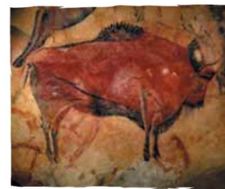
Cuevas de Altamira