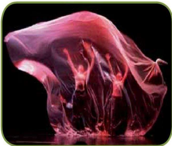
Obra "Entre mortales", escrita y dirigida por Juan Carlos Agudelo.

1. Observa los detalles de la imagen. Los elementos, las formas, la posición y ubicación de los personajes, y comenta acerca de lo que puede estar sucediendo