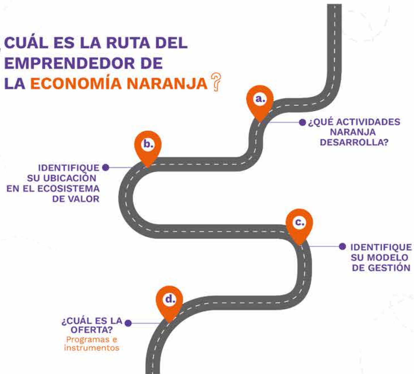
Imagen. Ruta del Emprendedor Naranja