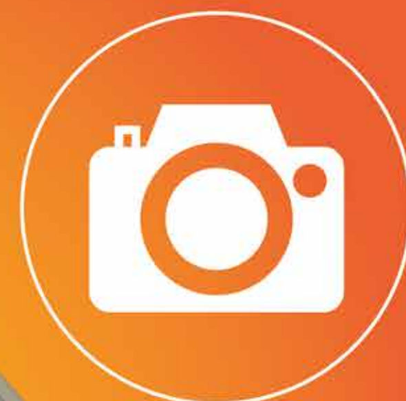
Imagen. Programas e instrumentos para emprendedores y organizaciones informales y comunitarios

Cada uno de estos ejes aplicada de manera particular según el modelo de gestión.